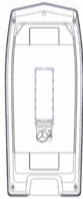
Gestaltung formbund